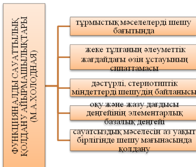
1-сурет. М.А. Холодная еңбегі бойынша функционалдық сауаттылық ұғымының негізгі белгілері

Тұлға өзінің кәсіби білімінің, іскерліктерінің, дағдыларының, тәжірибесінің және тұлғалық қасиеттерінің деңгейімен, оның өзіне қатысты үздіксіз білім алуымен, атқарған ісіне шығармашылықпен, жауапкершілікпен қарауымен ерекшеленеді. Осы аталған барлық қасиеттер білім берудің құрылымы мен мазмұнында ғана емес, сонымен қатар сауаттылық құрылымында да болуы тиіс. Біріншіден — тек қана кәсіби деңгейде өзекті болатын, сұранысқа толы функционалды сауаттылық, екіншіден — оның тек пәндік мазмұнға ғана тәуелді емес, сонымен қатар тұлғаның қасиеттерін қалыптастыратын компоненттері болып келеді. Функционалдық сауаттылыққа қол жеткізген оқушылар білім алуы барысында өмірдің қалыпты жағдайларында кездесетін түрлі жағдаяттардың шешімдерін таба алатын қабілетке ие болған. Негізінен, қолданбалы білімін жүзеге асыра алатын деңгейдегі білім иесі. Жинақтай алғанда, функционалдық сауаттылық оқушының жеке тұлғасының әлеуметтенуіне игі ықпал ететін басты тірек деп есептеледі.